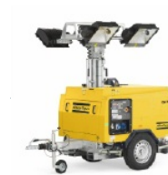
Torres de iluminación.