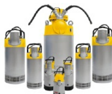
Bombas eléctricas sumergibles